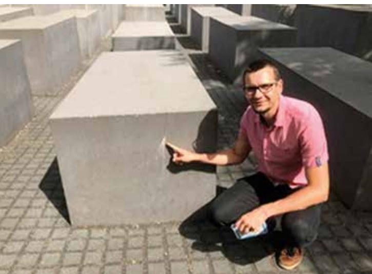
Fot. 5. Widok betonowych bloków tworzących Pomnik Pomordowanych Żydów Europy w Berlinie z symptomami prawdopodobnej reakcji alkalia-kruszywo (wysięki żelu, spękania) i wzmocnieniem obejmami z blachy