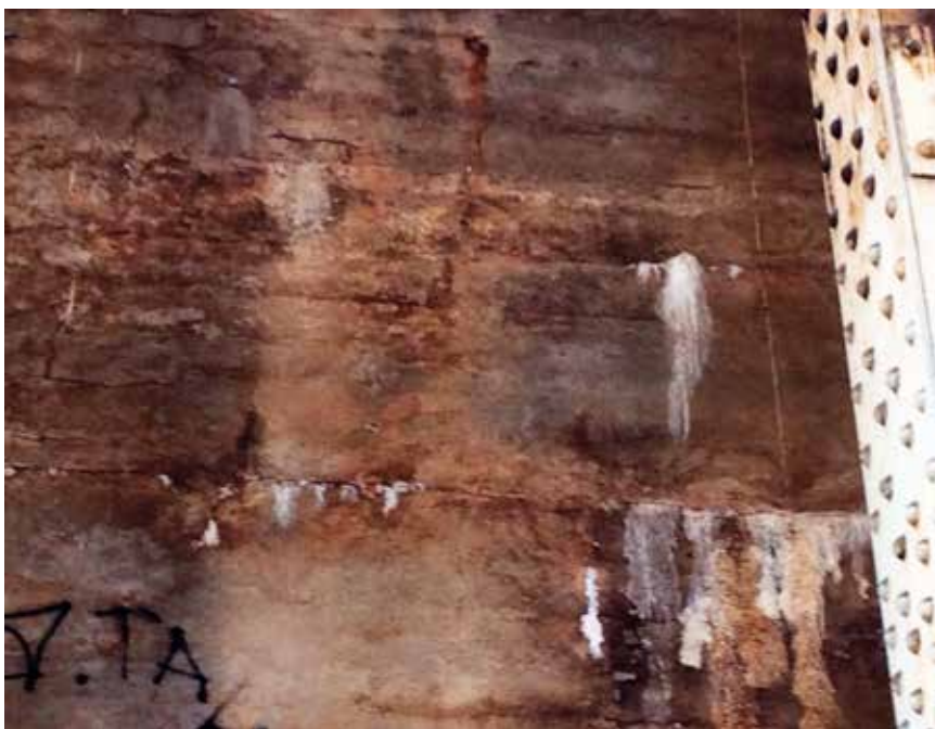
Fot. 2. Betonowy mur oporowy ze spękaniem i wysiękami m.in. z powodu reakcji alkalia-kruszywo

Dostępna dokumentacja uszkodzeń betonowych obiektów w Polsce w ogóle jest skąpa. Identyfikacja symptomów występowania szkodliwej reakcji alkalia-kruszywo nie należy do rutynowych czynności podczas przeglądów konstrukcji. Przynajmniej mnie nie wiadomo o odpowiednich instrukcjach dla inspektorów mostów czy innych konstrukcji inżynierskich. Zewnętrzne symptomy wystąpienia reakcji trudno odróżnić od uszkodzeń betonu wywołanych przez mróz, agresję siarczanową, korozję stali czy nadmierny skurcz przy wysychaniu. Są to na ogół spękania, odpryski, wykwyty oraz nadmierne deformacje – przesunięcie lub wypiętrzenie związane z pęcznieniem betonu. Charakterystyczne są wysięki substancji żelowej o mleczno-białym kolorze, chociaż nie zawsze występują. Nieumiejętność rozpoznania symptomów reakcji