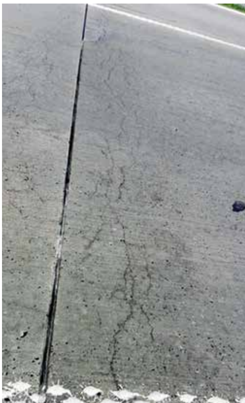
Fot. 3. Nawierzchnia betonowej drogi ze spękaniem i wysiękami m.in. z powodu reakcji alkalia-kruszywo

Elementarnym wskazaniem możliwości wystąpienia reakcji alkalia-kruszywo w betonie są spękania ziaren kruszywa lub specyficzne otoczki ziaren, które są widoczne gołym okiem na przekrojach od-